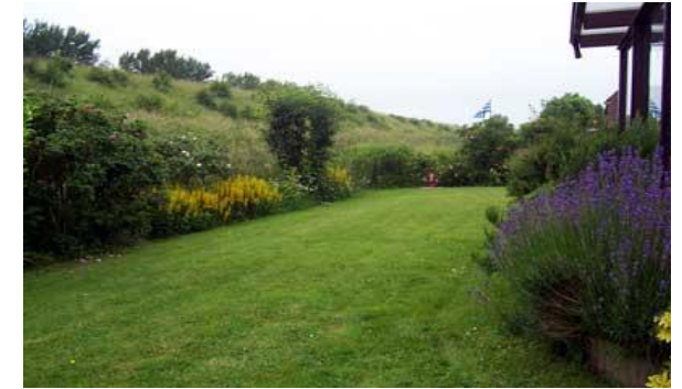
Der große Garten eignet sich hervorragend zum Spielen und Entspannen.

Genießen Sie in der kühlen Jahreszeit die wohlige Wärme am Kaminofen.