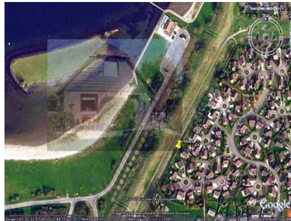
Die Satellitenaufnahme zeigt die direkte Lage am Veerse Meer.

Autominuten Entfernung befindet sich ein ausgewiesener Surfstrand. Der Supermarkt im Dorf Wolphaartsdijk und ein sieben Tage geöffneter Sommermarkt am Yachthafen sind etwa drei Kilometer entfernt, ideal für eine kurze Radtour vor dem Frühstück. Das nächste Restaurant liegt direkt hinter dem Deich, drei weitere Restaurants sind in zehn Geh-Minuten erreichbar.