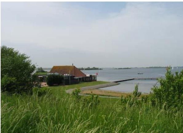
Blick über den Deich, gleich hinter dem Haus..

Das Haus befindet sich in erstklassiger Lage am Rande des Ferienparks – DE SCHELPHOEK – bei Wolphaartsdijk, direkt hinter dem Deich am Veerse Meer. Das Ferienhaus ist in einem absoluten TOP-Zustand und bietet mit seinen etwa 95 m 2 ausreichend Raum für 5-6 Personen. Das Veerse Meer und ein Strand sind fußnah gleich hinter dem Deich erreichbar.