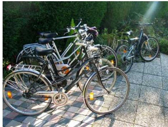
Nahziele erreichen Sie am besten mit dem Fahrrad. Fünf Fahrräder sowie zwei Kick-Boards sind im Preis inbegriffen!